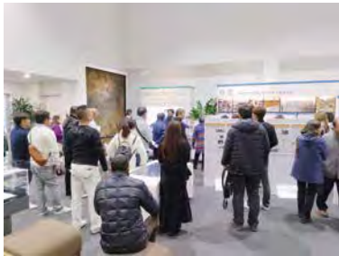
(いわき震災伝承みらい館)

福島へ向かうバスの中で『FUKUSHIMA50』のDVD鑑賞をしながら現地へと向かい、当時の原発内で何があったのか、また原発内にいた作業員が途中であきらめていたら今の