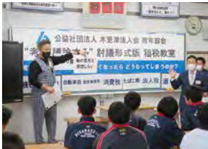
木更津市立木更津第一中学校