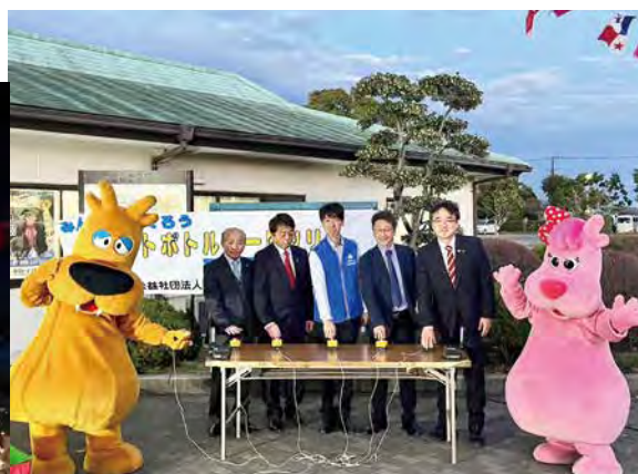
袖ヶ浦地区 「輝け☆ペットボトルアートツリー」