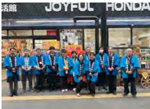
実施日：令和5年11月15日(水) 場 所：ジョイフル本田君津店