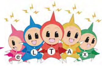
eLTAXイメージキャラクター 「エルレンジャー」