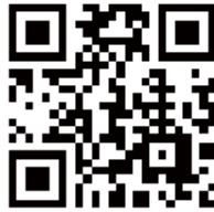
確定申告書等作成コーナー