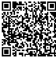
確定申告特集ページ