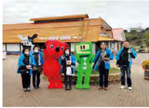
実施日：令和5年11月11日(土) 場 所：マザー牧場