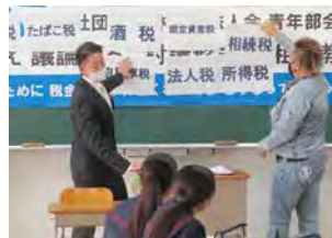
君津市立八重原中学校