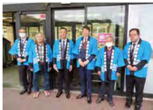
実施日：令和5年11月15日(水) 場 所：イオン長浦店