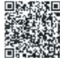
動画で見る確定申告