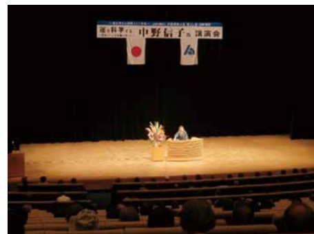
税を考える週間メイン事業 第21回公開講座 中野 信子氏講演会