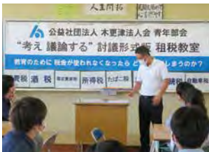
私立志学館中等部