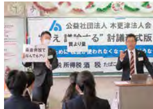
君津市立周西中学校

令和5年度の租税教室は、計7校に訪問し授業を実施しました。リピーターの学校に加え、初めて依頼を頂く学校も複数あり、少しずつ当部会が行う租税教育活動が浸透してきていることを感じました。今年度も開催した全ての学校からお褒めの言葉を頂くことができ、また私達も生徒さん達の活発な意見や笑顔を見ることができ、とても充実した時間を過ごすことができました。来年も引き続きより良い授業ができるよう試行錯誤しながら継続していきたいと思っております。